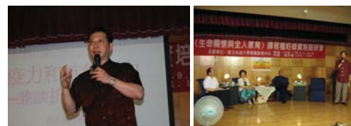
（左上）97年7月8、9、15日舉辦「生命關懷與全人教育」課程種子師資培訓研習，孫安迪醫師蒞校演講。 （右上）97年7月8、9、15日舉辦「生命關懷與全人教育」課程種子師資培訓研習，溫馨的綜合座談一景。