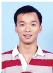
心眼放寬無界線 小處著手勤努力

感謝景文師長的教導之恩，能讓我不虛度人生最重要的學習階段，而「勤勞」、「信實」、「謙敬」、「創新」的校訓，看似簡單卻是指引我前進的明燈。此刻世界正面臨巨大的經濟衰退，各位學弟妹在畢業求職時，將會遇到更多的困難與挑戰，但千萬不要忘了學生時代的理想與初衷，在此與各位共勉之。再一次感謝各位師長的教誨與殷殷期盼。