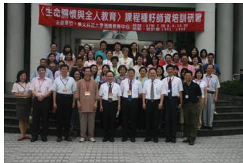
（上圖）97年7月8、9、15日舉辦「生命關懷與全人教育」課程種子師資培訓研習，與會人員全體合照。

全人教育的真諦。研習營除了設計靜態的議題式講座、綜合座談，另有安排戶外教學活動，於七月九日下午，在人文藝術學院劉易齋院長的帶領下，前往新店慈濟醫院參訪，瞭解慈濟志工的社會服務與大愛精神，體會「以人為本，尊重生命」的醫療特色，藉以深化研習者的學習面向。