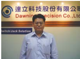
校訓是我人生發展的明燈

景文科技大學創校19年，培養了5萬多位校友，在社會上的各個階層努力扮演自己的角色。今年首次舉辦傑出校友遴選，主要是為了發掘在各領域中有卓越表現，足以作為後學楷模的校友，透過公開表揚的機會，將奮鬥歷程與人生經驗與大眾分享，提昇校譽並激勵在校學生。