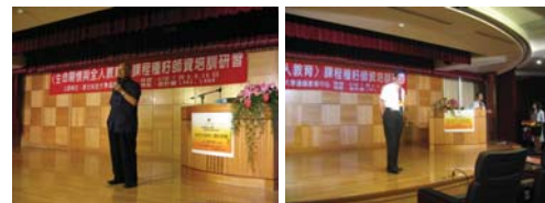
（左上）97年7月8、9、15日舉辦「生命關懷與全人教育」課程種子師資培訓研習，人文大師司馬中原蒞校演講。 （右上）97年7月8、9、15日舉辦「生命關懷與全人教育」課程種子師資培訓研習，輔仁大學黎建球校長蒞校演講。